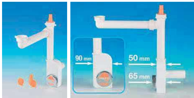
Sifone per lavello cucina ad 1 vasca Spazio 1NT Evolution

È rede del successo ottenuto dal suo predecessore, il Sifone Spazio 1NT Evolution non solo consolida la reputazione di affidabilità della famiglia dei sifoni Spazio NT, ma va oltre, introducendo nuove funzionalità accompagnate da un design moderno. La particolare conformazione del Sifone Spazio 1NT Evolution è stata attentamente studiata per aderire in modo ottimale alla parete di fondo, liberando uno spazio significativo nel sotto-lavello. Questo spazio aggiuntivo diventa quindi un pratico vano portaoggetti, ovvero un luogo ideale per riporre detersivi e utensili in modo accurato, conferendo al luogo di lavoro quotidiano della cucina un ambiente più ordinato e funzionale. Il nuovo design, caratterizzato da una forma disassata rispetto all'asse frontale, consente al sifone di adattarsi e compensare eventuali irregolarità durante l'installazione, offrendo una soluzione versatile e