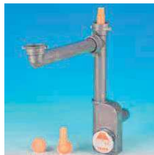
versione colore nero - grigio