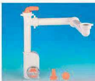
Esempi di componibilità degli elementi